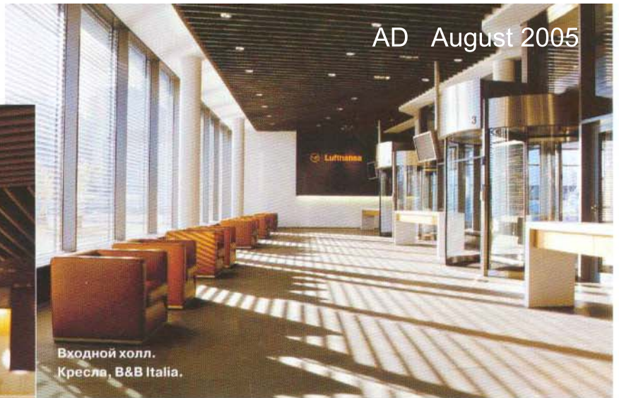
Входной холл. Кресла, V&V Italia.