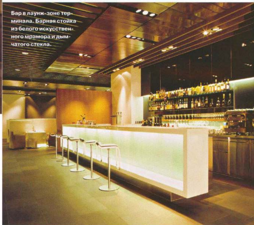
Бар в лаунж-зоне терминала. Барная стойка из белого искусственного мрамора и дымчатого стекла.